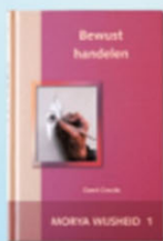
Morya Wijsheid 1: Bewust handelen Geert Crevits

Door in jezelf te gaan en je dingen af te vragen, in overweging te nemen en ermee bezig te zijn, vind je rust.